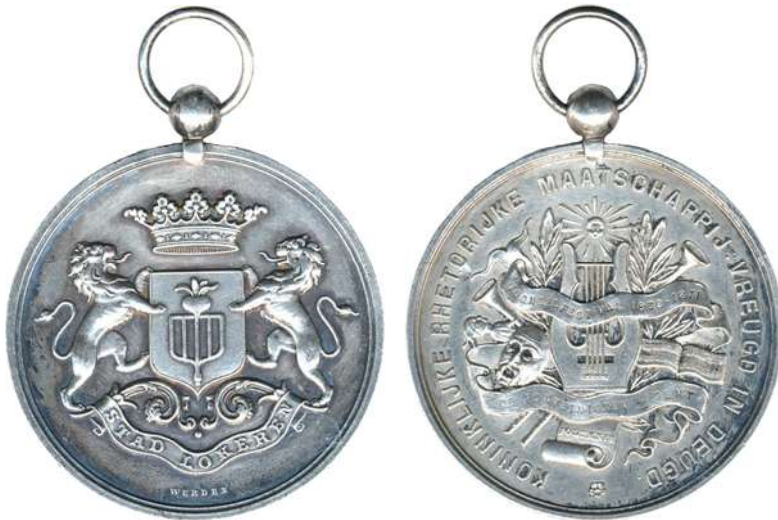
31. Penning voor de Tweede Prijs van de maatschappij Hoop en Liefde uit Antwerpen (1875)

Verzameling: patrimonium De Fontaine (inventaris nr. 40).