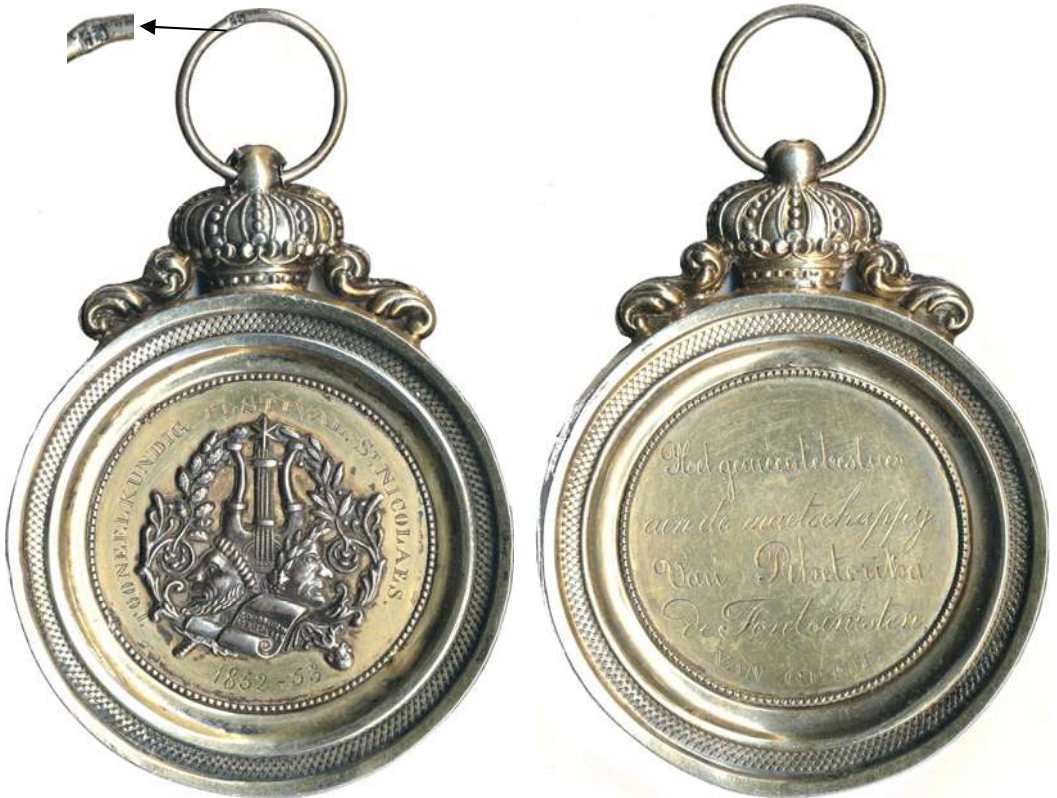
20. Penning voor het toneelfestival ingericht door de maatschappij Arm in de Borze en van zinnen Jong uit Veurne (1854)

In het seizoen 1853-1854 namen de Fonteïnisten deel aan het festival te Veurne georganiseerd door de plaatselijke toneelvereniging.