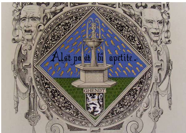
Embleem ontworpen in 1913