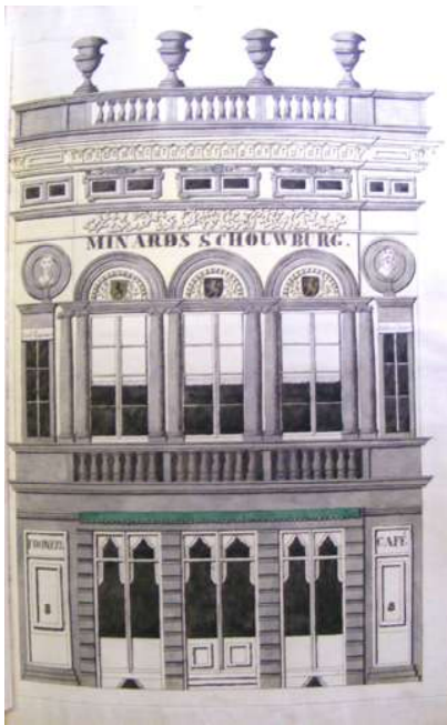
Minard-schouwburg (tekening Bevel)

Door hun protestantse inslag kenden ze een grote bloei tijdens het Nederlands bewind. Na de onafhankelijkheid van België werd de situatie om verschillende redenen heel wat moeilijker. De Fonteine moest het ontslag verwerken van haar belangrijkste acteur, Karel Onderet, en raakte tussen 1837 en 1840 haar zaal in de Parnassusberg kwijt. In 1840 trokken een aantal leden weg en richtten samen een nieuw gezelschap Broedermin en Taalijver op, onder de leiding van Karel Onderet en Hippoliet van Peene.