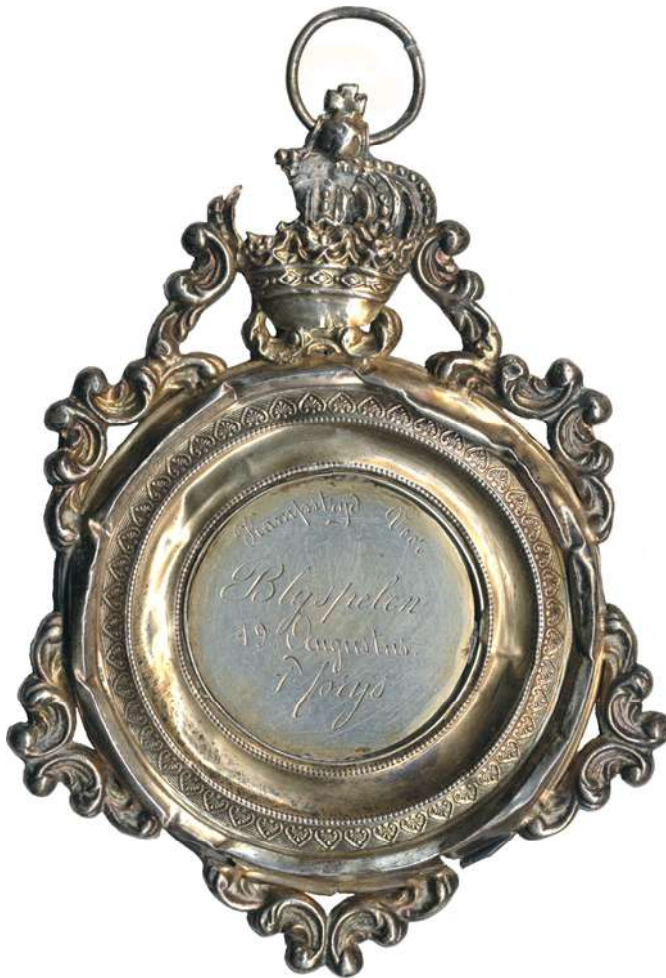
24. Penning voor het vijftig jarig bestaan van de rhetoricamaatschappij Voor Eer en Kunst uit Geraardsbergen (1860)

Verzameling: patrimonium De Fontaine (inventaris nr. 55).