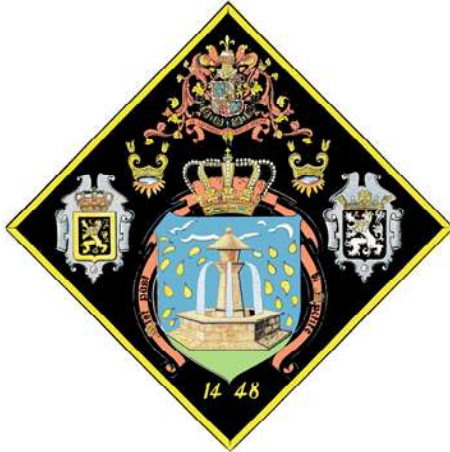
Wapenschild uit 1448

Vanaf de 19 de eeuw keerde men terug naar het oorspronkelijk blaozen, nadat de statuten uit 1448 weer aan het licht gebracht waren. Dit blaozen werd getekend door P. Goetghebuer.